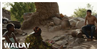
WALLAY Frankreich & Burkina Faso

Am 6. Mai entscheiden europaweit nahezu 3.000 Kinder im Alter von 12 bis 14 Jahren über den besten europäischen Kinderfilm. Der junge Filmpreis findet mittlerweile in 46 europäischen Städten, verteilt auf 36 europäische Länder, statt, und hat es sogar über Europa hinaus bis nach Australien geschafft. Neben Brisbane zieht der Young Audience Film Day seine Kreise von Lissabon (Portugal) bis Tel Aviv (Israel). An allen Orten werden am selben Tag durch Kinderjurs die drei nominierten Filme angeschaut: GIRL IN FLIGHT (Italien), HOBBYHORSE REVOLUTION (Finnland) und WALLAY (Frankreich/Burkina Faso/Qatar). Seit 2012 und damit von Anfang an ist für Deutschland die Deutsche Kindermedienstiftung Goldener Spatz als Mitveranstalter dabei. In Erfurt werden jedoch nicht nur die Filme gezeigt, sondern hier laufen auch alle Fäden zusammen. Zum Abschluss des Tages melden alle Kinderjurs ihre nationalen Ergebnisse ins CineStar, wo auch der Europäische Kinderfilmpreis überreicht wird. Das kann auch live mitverfolgt werden: 6. Mai ab 20.00 Uhr auf yaa.europeanfilmawards.eu .